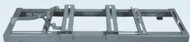
APARELHO N° 1 - MOTOR ATÉ 12,5CV