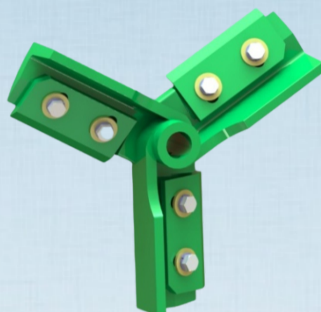
ROTOR - EC MINI