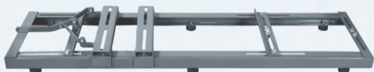
APARELHO N° 2 - MOTOR ACIMA DE 12,5CV

Sistema de mudança de corte por POLIA E CORREIA