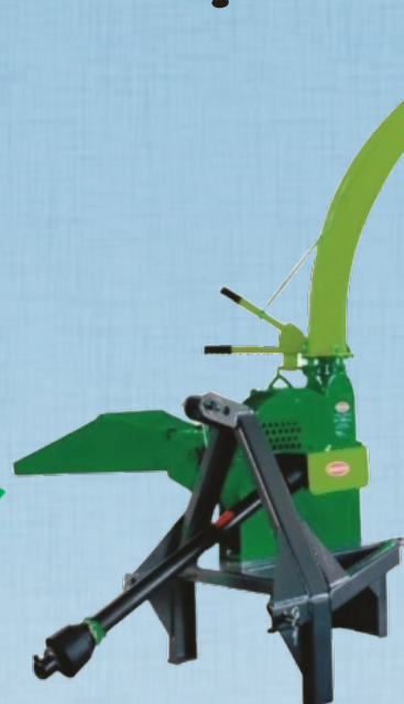
ECT - 4.000 PLUS ECT - 4.800 PLUS