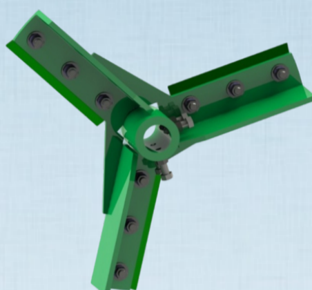
ROTOR EC - 4.000 / 4.800 ECT- 4.000/ 4.800 PLUS ECTR - 4.000/ 4.800 PLUS