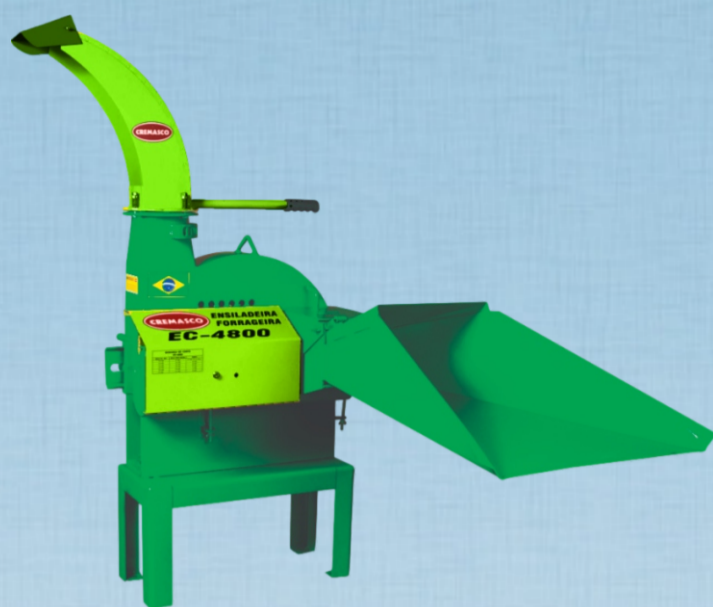
EC - 4.000 NO CAVALETE EC - 4.800 NO CAVALETE