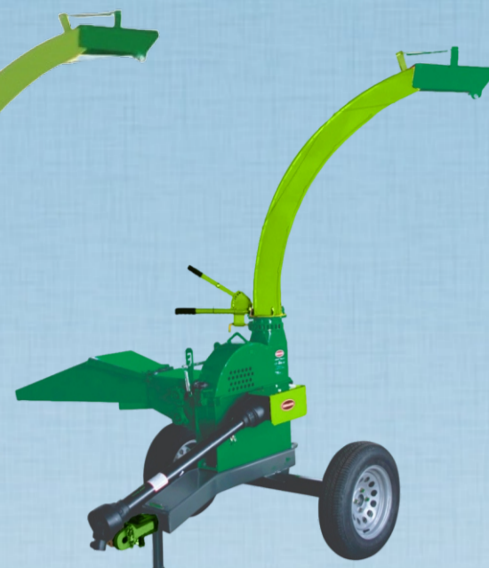
ECTR- 4.000 PLUS ECTR- 4.800 PLUS