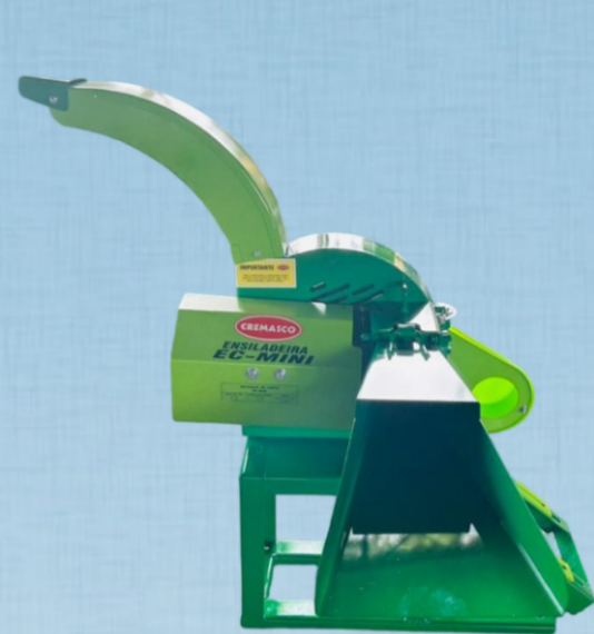
EC MINI NO CAVALETE